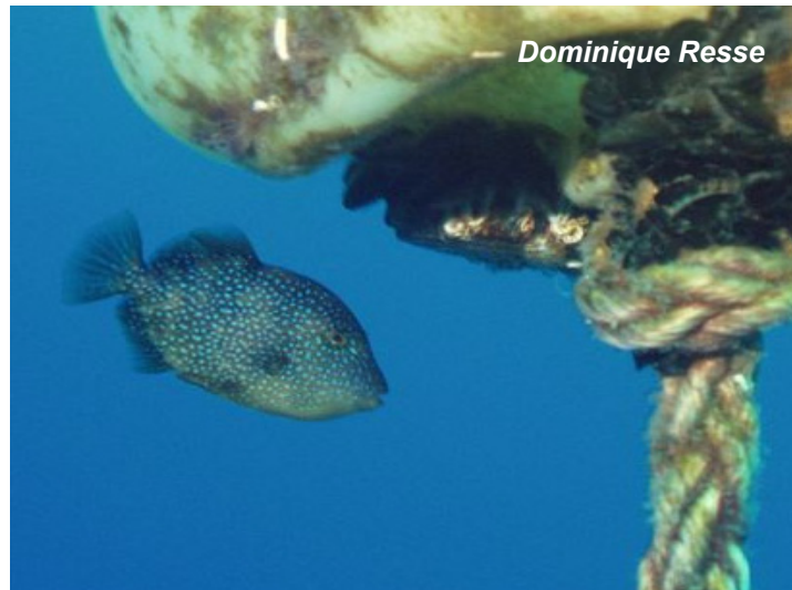
C'est pas mignon un baliste juvénile ?

Sa robe grise terne est beaucoup moins chatoyante que celle de ses cousins tropicaux. Des marbrures bleues irisées apparaissent sur la voile de ses nageoires. La tête avec ses petits yeux au sommet représente le quart de son corps. Sa petite bouche aux lèvres charnues laisse entrevoir une dentition imposante. La particularité du baliste est l'impressionnante première épine de sa nageoire dorsale qui se dresse en cas de danger et se bloque en position verticale avec un système de cran d'arrêt au niveau de la seconde épine. Sa queue a une très jolie forme en croissant.