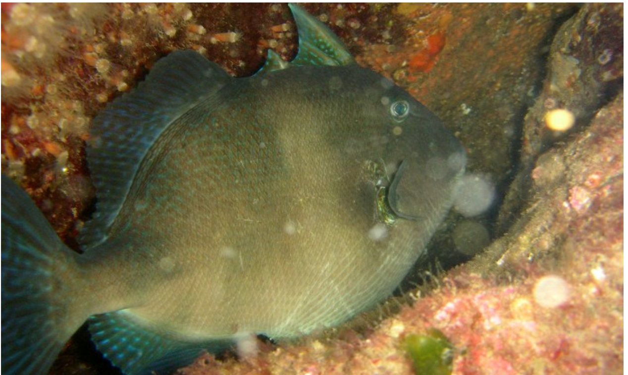
L'épine se redresse : méfiance...