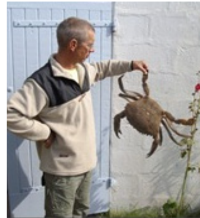
Etrille record à Oléron !