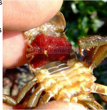
Femelle portant sa ponte

La reproduction se fait par copulation comme le homard. La femelle portera ses œufs quelques semaines jusqu'à l'éclosion à partir d'avril. (il est possible qu'il y ait un 2 e cycle reproductif durant l'été). Après une période larvaire planctonique où elle subira 4 mues, les galathées juvéniles se posent et vivent en bordure littorale. Ensuite, elles gagnent des profondeurs plus importantes. Cela signifie que les galathées rencontrées en plongée sont toutes des adultes. La galathée peut vivre 5 à 10 ans.