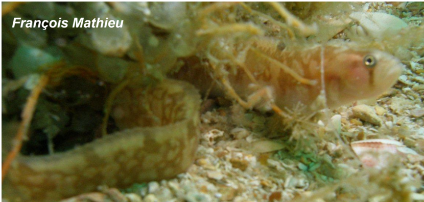
Gonnelle sur l'UJ 1404

La gonnelle atteint sa maturité sexuelle à 3 ans (20cm.). La période de frai va de novembre à Janvier. En dessous de 25m., la femelle va pondre entre 80 et 200 œufs collants bien à l'abri entre 2 pierres ou dans les coquilles vides d'un bivalve. Le couple ou souvent seulement la femelle montera la garde sans se nourrir pendant 1 ou 2 mois jusqu'à l'éclosion. Les larves de 9mm. à la naissance commenceront une vie pélagique. Ce n'est qu'arrivés à 35mm. que les jeunes adopteront une vie benthique (sur le fond comme leurs parents)