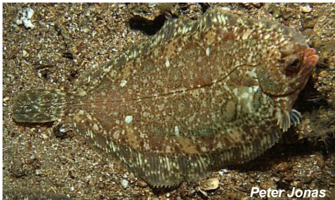
Une vraie p'tite reine du camouflage