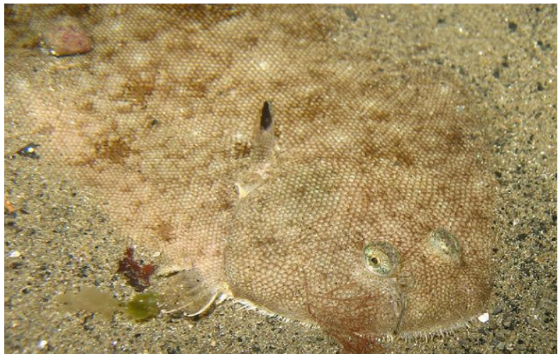
C'est pourquoi ?... Vous voyez pas qu'elle dors durant la journée !