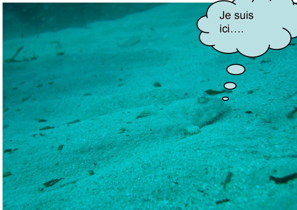
Quand j'vous dis qu'elle est discrète

Importance économique : La sole est un poisson hautement commercial, très prisé des consommateurs et dont le prix est élevé. Sa chair délicate est très renommée. La taille légale de capture en Manche est de 24cm (c'est-à-dire immature!...). La demande étant forte, un marché de l'importation s'est développé mais les cousines tropicales sont nettement plus fades.