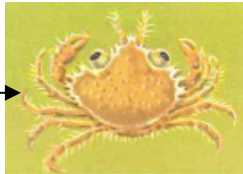
Aspect à 5 semaines au début de la vie sur le fond