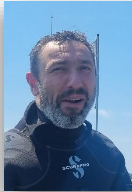
Bruno MF1 / E3