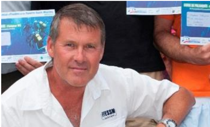
Jo Directeur de plongée - gérant du Centre DES-JEPS – BEES2 et Instructeur National de la FFESSM