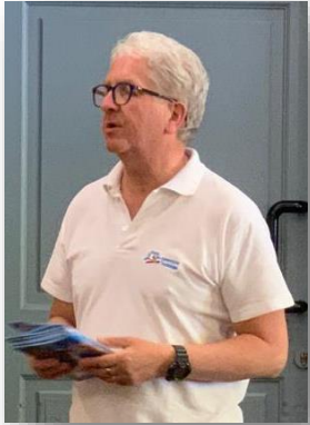
Michel MF2 / E4